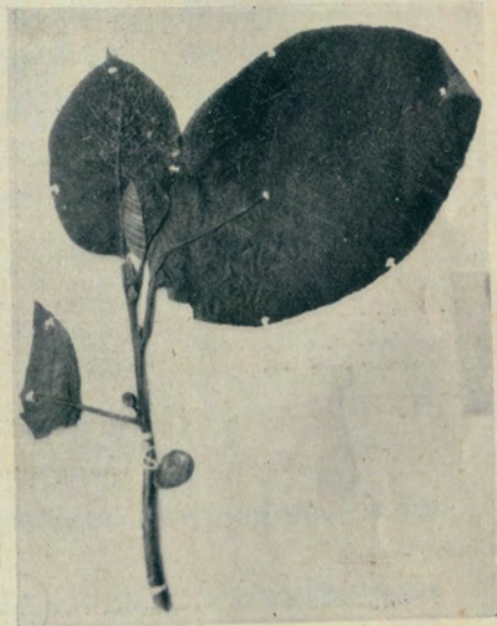
23. Artocarpus ficifolia W. T. Wang (中苏考察队676)