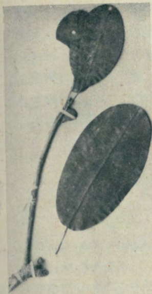
21. Ficus Fedorovii W. T. Wang (中苏考察队3226)